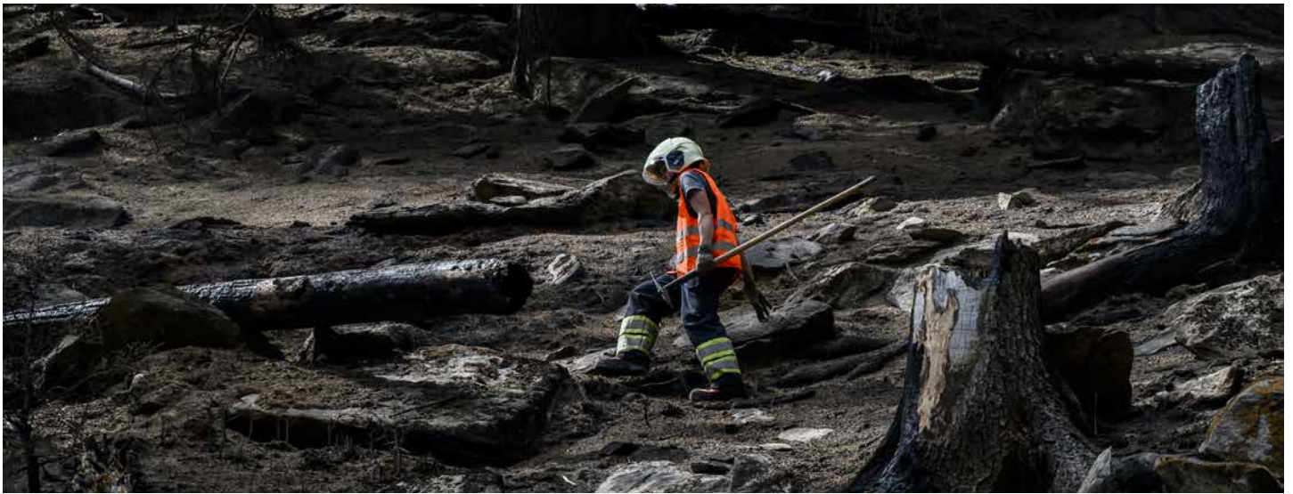
Immagine: Lavori di sgombero dopo l'incendio boschivo a Bitsch nel 2023