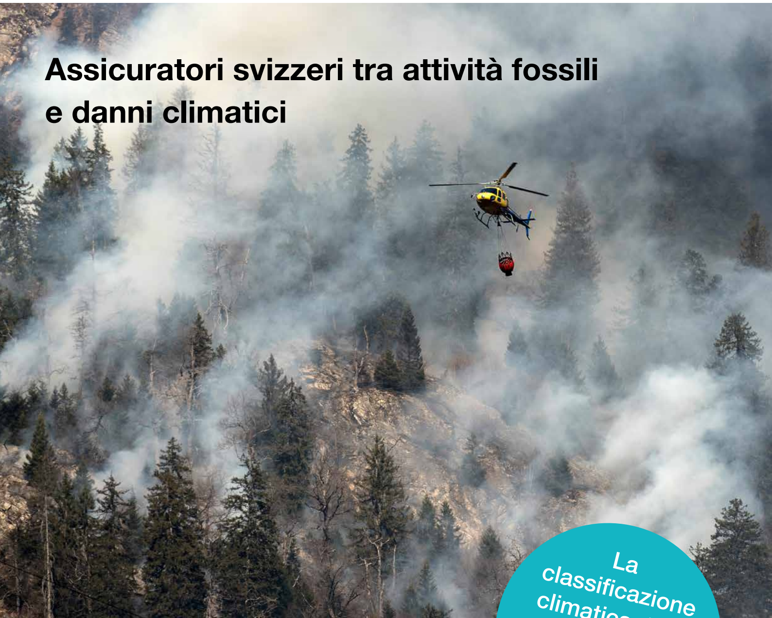
Immagine: Operazioni di spegnimento durante l'incendio a Mesocco nel 2016

Assicuratori svizzeri tra attività fossili e danni climatici